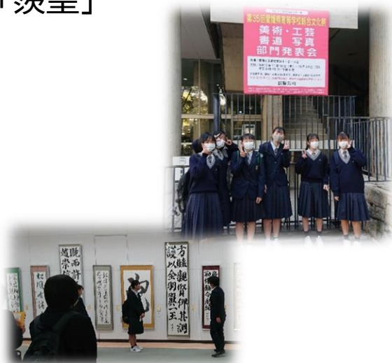
書道部・美術部出品