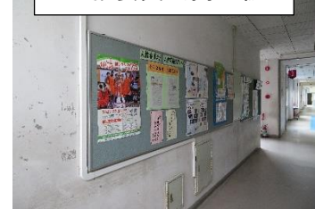
人権委員会掲示板

19～23日の挨拶当番時に、皆さんから気持ちのいい挨拶を返してもらい、清々しい気持ちになりました。よりよい学校生活になるよう、僕たちも頑張ります！