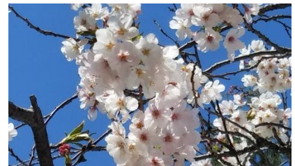
本校体育館横の桜