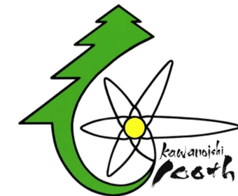
創立 100 周年記念シンボルマーク