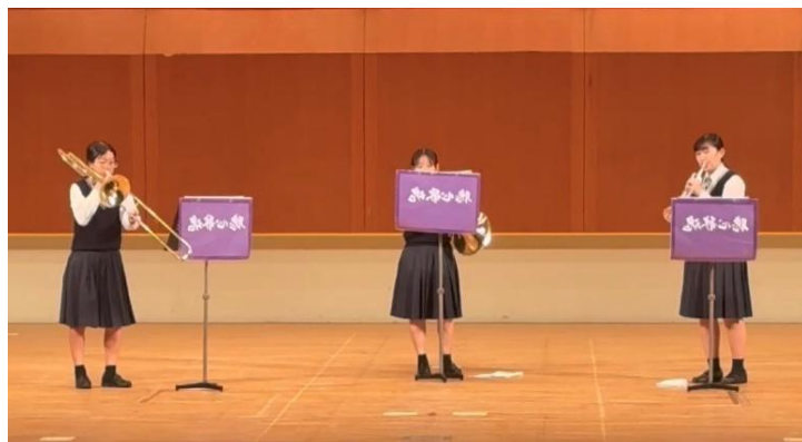
金管三重奏 銀賞 「ホルン、トランペットとトロンボーンのためのソナタ」

高校生活最後のアンサンブルコンテストに3年次3人で出場でき、とても嬉しかったです。「毎日楽器を演奏できることが当たり前ではない、1日1日が大切だ。」という思いをもって練習していました。曲は非常に難易度の高いものでしたが、満足のいく演奏ができました。中学校から高校まで6年間吹奏楽をやってきて、本当に楽しかったです。今まで支えていただいたみなさんに感謝したいです。