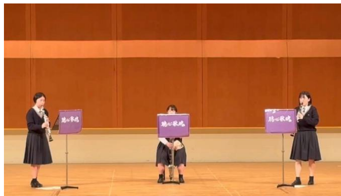
木管三重奏 銀賞 「月は優しく愛を照らす」

学年の違う3人で組んだので、練習時間が思うようにとれなかったですが、何とか工夫しながら曲を作っていました。3人とも好きな曲だったので、本番のよく響く舞台上で演奏しているときは楽しかったです。音楽で表現することは楽しいと改めて感じた大会でした。ありがとうございました。