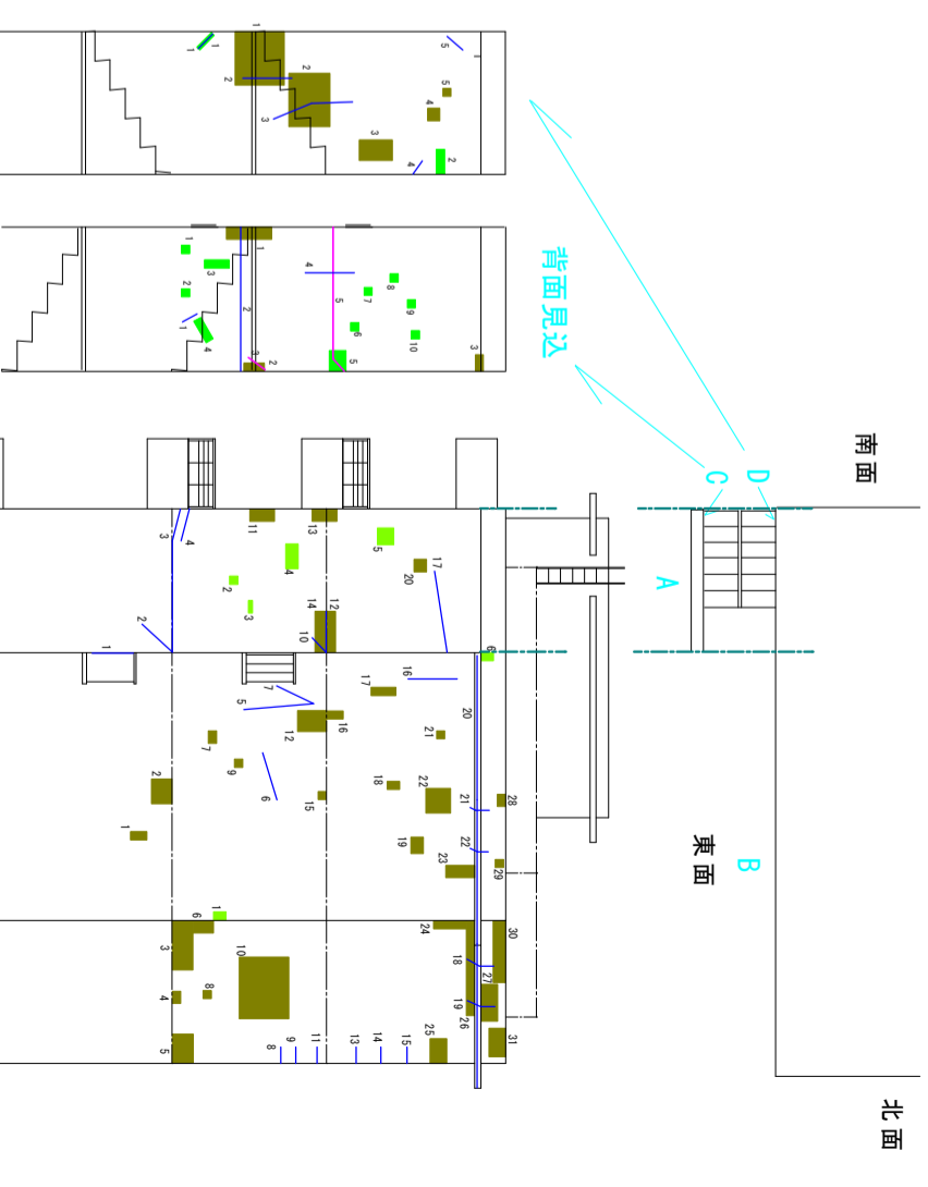
東面 立面图 S=1/200